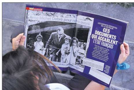
Le dossier des enfants dits de la Creuse est loin d'être fermé.