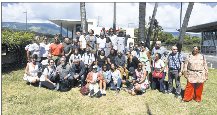
Après un groupe de 47 enfants de la Creuse en 2023, d'autres seront de retour sur leur terre natale d'ici la fin de l'année.

Le père de Yannick est maintenant âgé. Il fera bientôt le voyage une dernière fois vers son île natale. Accompagné de son fils. Pour tenter de redécouvrir La Réunion lontan. Ce temps où il n'était pas encore un enfant de la Creuse.