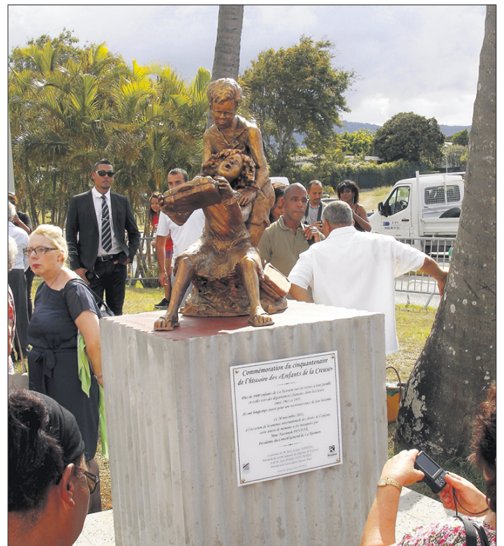
La sculpture de de Nelson Boyer, œuvre d'art en mémoire des enfants exilés, inaugurée en 2013 à l'aéroport.